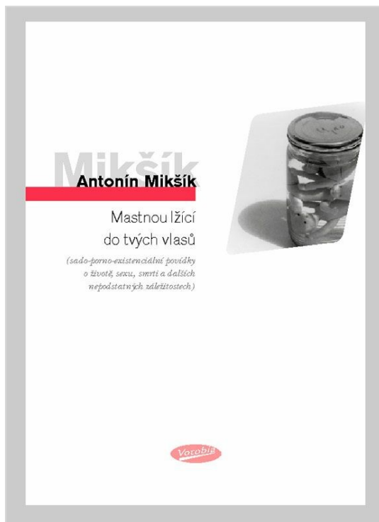
Nakladatelství Votobia, 2006 (návrh obalu)